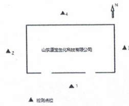
附件 1: 山东康宝生化科技有限公司厂界噪声检测点位图