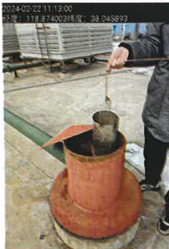
图 1 污水采样照片