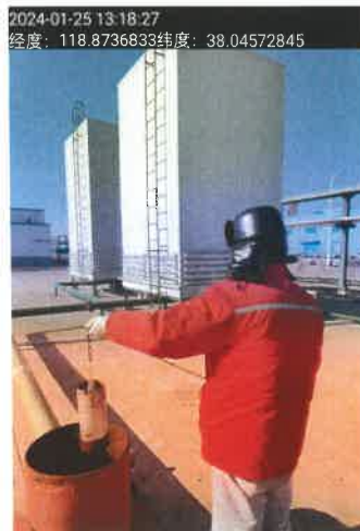
图 1 污水采样照片