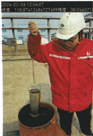
图 1 污水采样照片