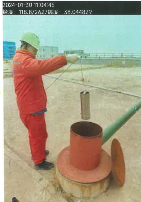
图 1 污水采样照片