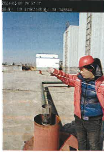
图 1 污水采样照片